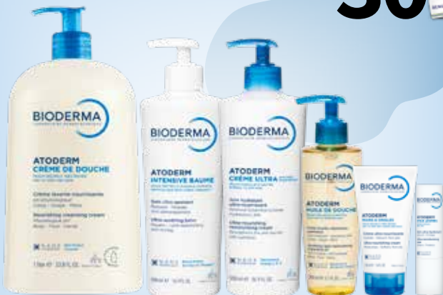
BIODERMA ATODERM linijos produktams