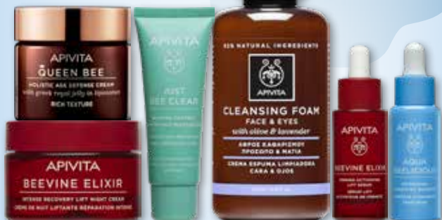
APIVITA | Veido priežiūros priemonėms