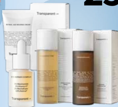
TRANSPARENT LAB Atrinktomis veido priežiūros priemonėms