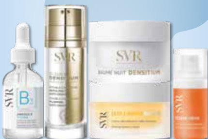
SVR Veido kremams ir serumams