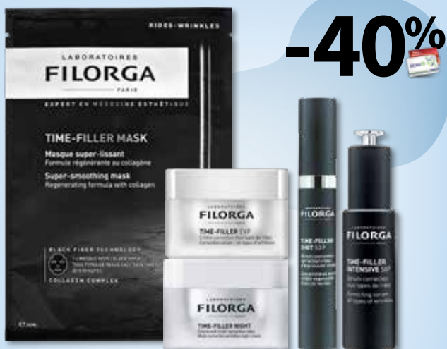
FILORGA TIME-FILLER kosmetikos linijai