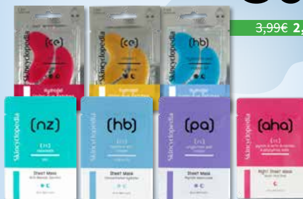
SKINCYCLOPEDIA Lakštinės veido kaukės ir gelinės paakių kaukės