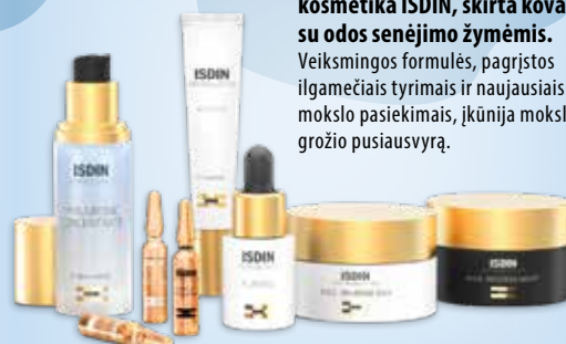
GROŽIS ĮKVĖPTAS MOKSLO

Ispanų dermatologinė kosmetika ISDIN, skirta kovai su odos senėjimo žymėmis. Veiksmingos formulės, pagrįstos ilgamečiais tyrimais ir naujausiais mokslo pasiekimais, įkūnija mokslo ir grožio pusiausvyrą.